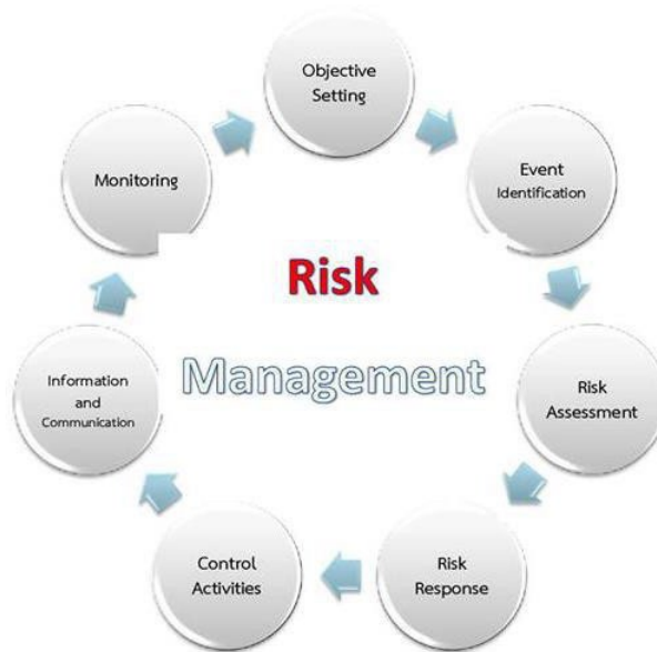
ภาพที่ ๒ กระบวนการบริหารจัดการความเสี่ยง

การบริหารความเสี่ยงและการควบคุมภายในประกอบด้วย ๘ องค์ประกอบ ที่มีความเกี่ยวข้องซึ่งกันและกัน ดังแผนภาพที่ ๒ ทั้งนี้องค์ประกอบเหล่านี้เกิดจากการปฏิบัติงานร่วมกันของฝ่ายบริหาร ฝ่ายปฏิบัติงาน และฝ่ายสนับสนุนครอบคลุมทุกหน่วยงานในองค์กร ผสมผสานเข้ากับกลยุทธ์ในการบริหารจัดการ โดยมีความเชื่อมโยงกันในทุกระดับจากระดับองค์กรสู่ระดับฝ่ายดำเนินกิจกรรมและเป็นกระบวนการที่ดำเนินการอย่างต่อเนื่องภายในองค์กร องค์ประกอบการบริหารความเสี่ยงและการควบคุมภายใน ได้แก่