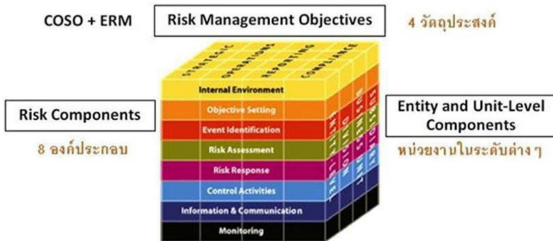
ภาพที่ ๑ ตามมาตรฐาน COSO (Committee of Sponsoring Organization of the Tread Way Commission)

การบริหารความเสี่ยงและการควบคุมภายในประกอบด้วย ๘ องค์ประกอบ ที่มีความเกี่ยวข้องซึ่งกันและกัน ดังแผนภาพที่ ๒ ทั้งนี้องค์ประกอบเหล่านี้เกิดจากการปฏิบัติงานร่วมกันของฝ่ายบริหาร ฝ่ายปฏิบัติงาน และฝ่ายสนับสนุนครอบคลุมทุกหน่วยงานในองค์กร ผสมผสานเข้ากับกลยุทธ์ในการบริหารจัดการ โดยมีความเชื่อมโยงกันในทุกระดับจากระดับองค์กรสู่ระดับฝ่ายดำเนินกิจกรรมและเป็นกระบวนการที่ดำเนินการอย่างต่อเนื่องภายในองค์กร องค์ประกอบการบริหารความเสี่ยงและการควบคุมภายใน ได้แก่